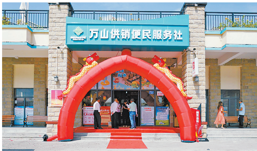
万山供销便民服务社开业。

本报讯(记者余映薇)10月21日,万山区万山镇万山供销便民服务社正式开业,为东澳岛居民和游客提供集农贸生鲜、生活零售、旅游文创、海岛特产和爱心驿站为一体的综合便民服务,增强海岛群众的幸福感和获得感,推动美丽圩镇服务功能提档升级。该社由珠海市供销合作联社与万山镇政府合作建设。