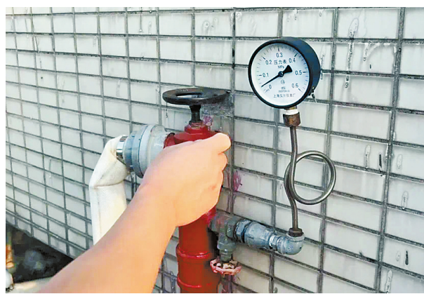
室内消防栓系统水压不足。

本报讯(记者刘雅玲)近日,香洲区消防救援大队消防监督员在检查中发现,嘉年华国际公寓存在火灾报警系统、室内消防栓系统、机械防烟系统未保持完好有效等多处消防安全隐患,遂对相关违法行为进行了依法查处,责令其限期整改。