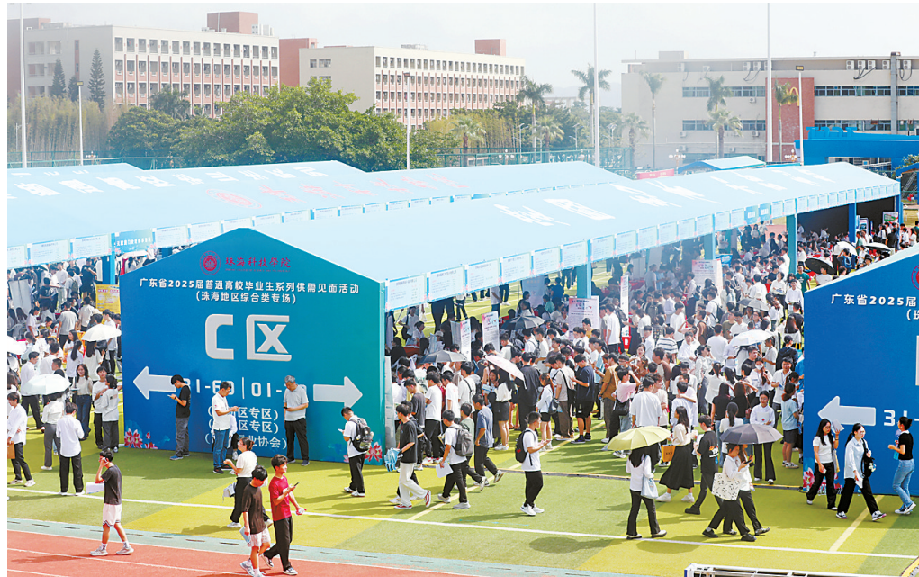
“粤就业”活动现场。

本报讯(记者甘丰恺)10月20日,“粤就业”广东省2025届普通高校毕业生系列供需见面会(珠海地区综合类专场)在珠海科技学院顺利举行。本活动由广东省教育厅主办,珠海科技学院承办。