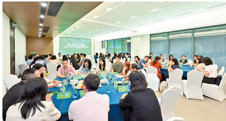
“新出版形势下大湾区采访工作与馆藏建设”研讨会在北师大珠海校区举行。

此次研讨会的成功举办,不仅为粤港澳大湾区的图书馆界搭建了一个交流合作的平台,也为大湾区图书馆在新出版形势下的采访工作与馆藏建设提供了新的思路与策略。与会嘉宾纷纷表示将以此次研讨会为契机,进一步加强交流与合作,共同推动大湾区图书馆事业的蓬勃发展,为粤港澳大湾区的文化遗产与创新注入新的活力与动力。