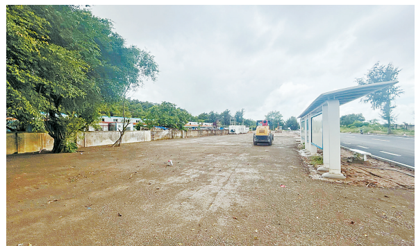
金凤台上下客接驳点。