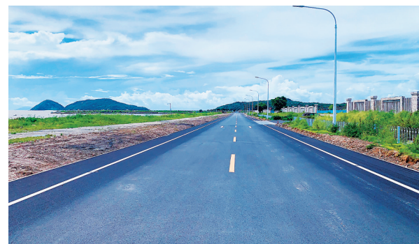
升级改造后的海滩路。