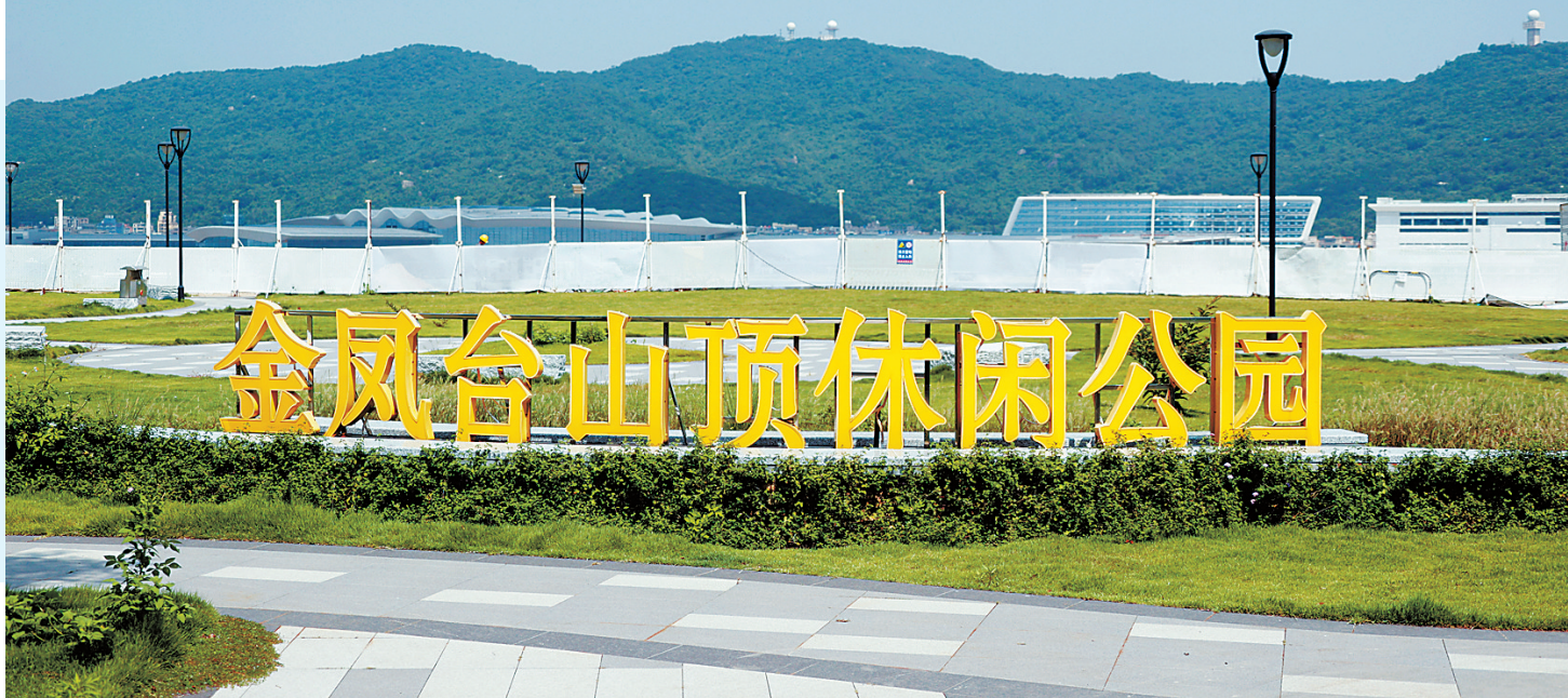
金凤台山顶休闲公园。