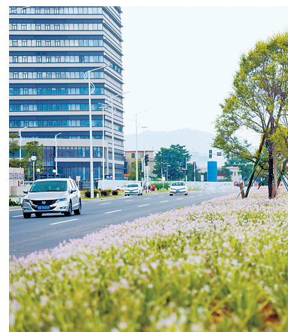
科港大道上的风雨兰。