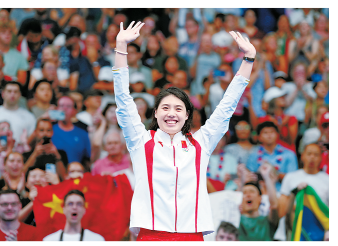
8月1日，中国选手张雨霏在颁奖仪式上。

据新华社巴黎8月1日电 在发烧和生理期的双重不适下，张雨霏拼下了巴黎奥运会女子200米蝶泳铜牌，以个人7块奥运奖牌成为中国游泳“第一人”。 场外，她在“没有硝烟的战场上”继续战斗，霸气回击外媒反复纠缠的兴奋剂话题：“美国的菲尔普斯、莱德茨基那么厉害，你们怎么不去质疑？” 女子200米蝶泳的赛后新闻发布会，由于另外两位获奖选手参加后面的接力比赛，变成了张雨霏的个人专场。发布会上有外媒发问，由于中国游泳运动员涉及食物污染事件，频繁检查和外界质疑是否影响了中国游泳的表现。 “对我们中国运动员更多次数的兴奋剂检查，我觉得我们应该配合，因为在出现此次事件之后，无论中国还是外国运动员，检查次数都在相应增加。配合检查是我们每一名运动员或者优秀运动员都应该做的事情。” 张雨霏平静地回答：