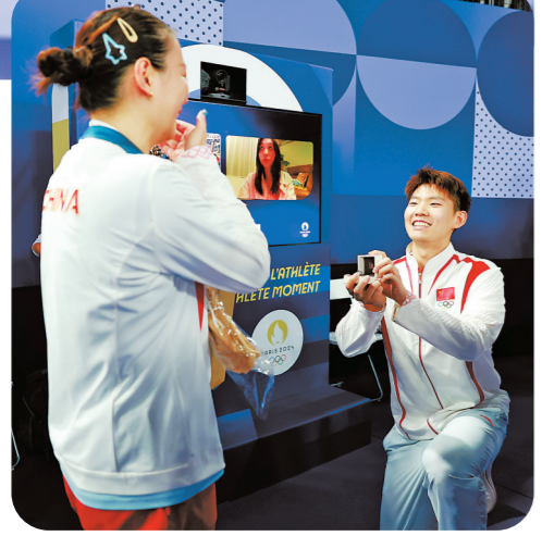
▲8月2日，在混合双打颁奖仪式后，中国羽毛球运动员刘雨辰(右)在赛场上向黄雅琼求婚。 新华社发

▲8月2日，中国组合郑思维(左)/黄雅琼在比赛庆祝。 当日，在巴黎奥运会羽毛球混合双打决赛中，中国组合郑思维/黄雅琼2:0战胜韩国组合金元昊/郑娜银，夺得金牌。 新华社发