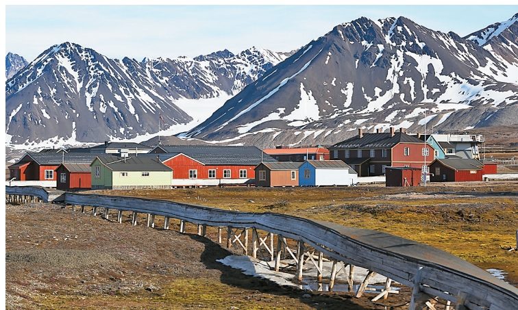
这是6月21日拍摄的挪威新奥勒松小镇景色。

位于挪威斯瓦尔巴群岛的小镇新奥勒松,地处北纬79度,是最靠近北极的人类定居点之一。