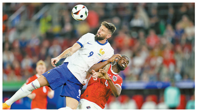
法国队球员吉鲁(上)与奥地利队球员丹索拼抢。