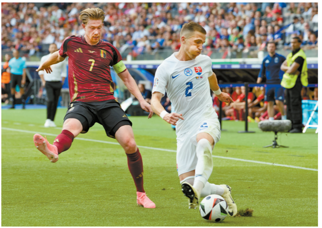
这场比赛比利时队长德布劳内(左)传出了4次关键传球,但都被队友挥霍一空。

内拿球连续假动作后流畅衔接下底传中,门前沃贝尔头球解围失误自摆乌龙。 比赛第55分钟,姆巴佩本有机会进球,只可惜获得单刀机会的他射门偏出,“神龟”也只能无奈苦笑。 姆巴佩在欧锦赛上已经总计有18次射门,但仍未取得进球,如今又遭遇伤病,他,进球何时才能到来? 根据赛程,下轮比赛法国队将在北京时间6月22日凌晨与荷兰队上演“强强对话”。