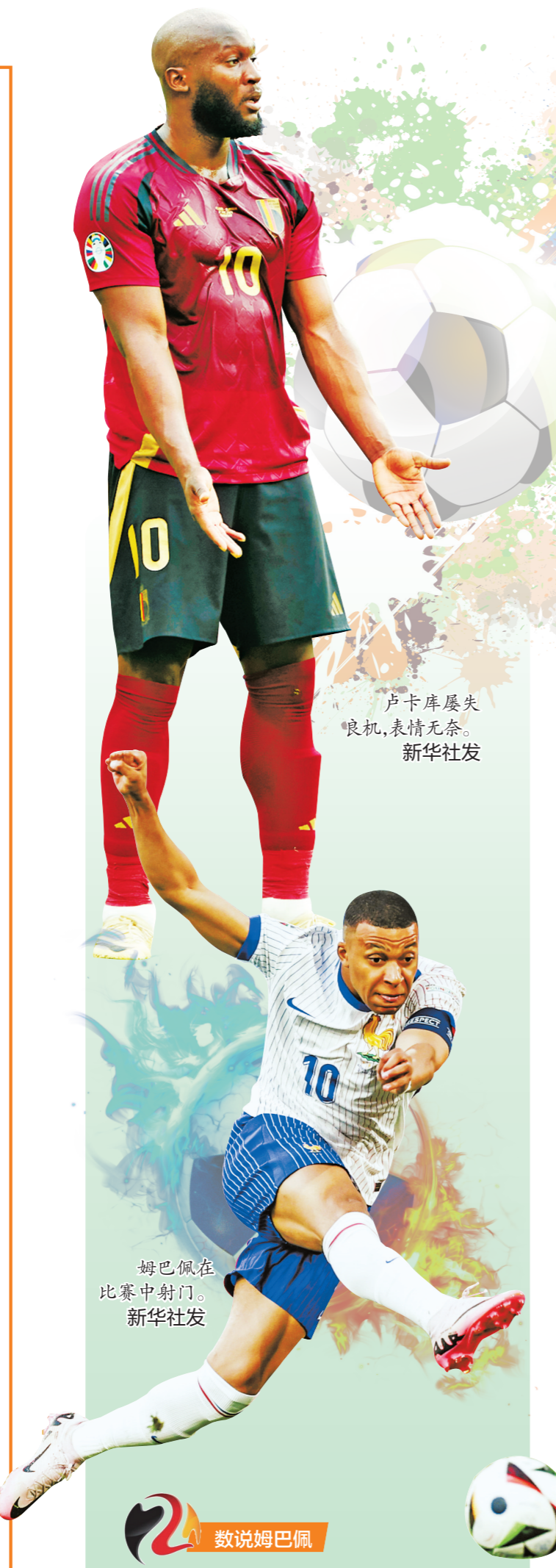
卢卡库屡失良机,表情无奈。

除了来自中国的5家官方全球合作伙伴,在电视机前熬夜看球的中国观众以及不辞辛劳、现场观赛的中国球迷外,还有一个群体与欧锦赛产生了直接关联,那就是中超旧将。 17日的欧锦赛小组赛上,曾效力于中超联赛武汉三镇队的斯坦丘踢出一脚技惊四座的“世界波”,帮助罗马尼亚队3:0击败乌克兰队。赛后,斯坦丘被评为全场最佳球员。欧足联技术观察小组对他的评价是:“他的进球极大鼓舞了队友。从技术上讲,他的进球堪称完美,展示了很好的平衡性。从战术上讲,他是整个战术体系的中枢。” “除了我的孩子们出生的那些天外,今天就是我人生中最开心的一天。”斯坦丘说,“这是我职业生涯的最佳进球,国家队球衣对我来说意味着一切。” 欧锦赛刚刚开始,面对大胜,斯坦丘依然保持冷静:“我