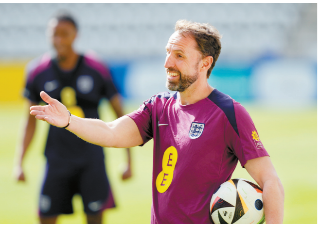
英格兰队主教练索斯盖特在训练中。

1:0小胜首次跻身欧锦赛决赛圈的塞尔维亚队,对身价最高的英格兰队来说,这个比分肯定不算过瘾。当然,赢球多少是次要,3分到手是主要的,本届欧锦赛夺冠大热门英格兰队能否真正展示欧锦赛最贵球队的分量,现在下结论为时尚早。 随着一批青年才俊的崛起,近几年英格兰成为国际足坛最具光彩的球队之一,世界杯、欧锦赛无不被视为冲冠大热门,一改以往二流豪门的角色。英格兰足球实力足够强大,不过运气却不怎么样,三年前首次冲到欧锦赛决赛,冠军争夺战点球大战3:4惜败于意大利队,与欧锦赛冠军奖杯擦肩而过。 2022年卡塔尔世界杯,群星闪耀的英格兰同样是夺金大热门。结果在1/4决赛中英格兰遇到法国队。两强相拼必有一伤,英法大战倒下的是英格兰。冲冠道路上,强大的英格兰足球又一次壮志未酬。 本届欧锦赛,英格兰队仍然是最具冠军相的球队之一。时下的英格兰足球正处于冲击欧锦赛的最佳时机,俗话说“事不过三”,过去三年两度折戟的英格兰足球,在本届欧锦赛能否一鼓作气冲到终点呢? 对于主帅索斯盖特的战术,曼联主教练滕哈格直言太过保守:“英格兰队踢得太被动,1:0领先后索斯盖特就决定让队形保持紧密,撑过比赛的剩余时间。”更有球迷无奈感叹:“索斯盖特就是那种会在电量还有99%时,把手机调成低电量模式的人。” (央视新闻客户端)