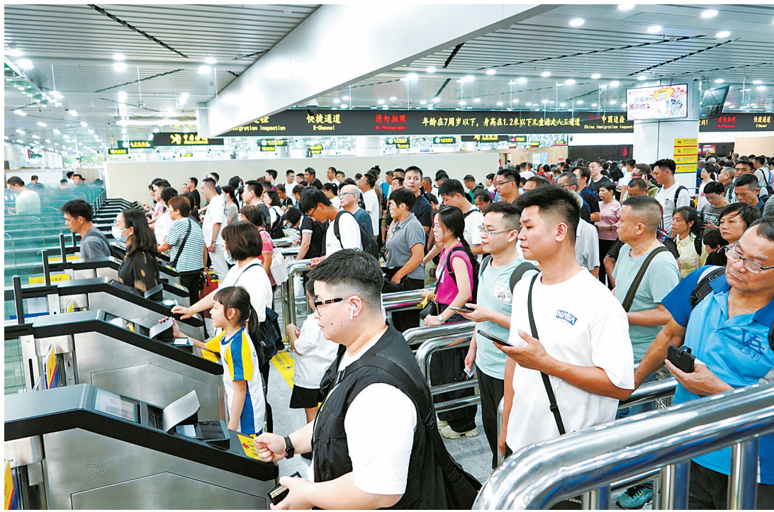
6月8日,拱北口岸通关客流。

为应对节假日增长的客流高峰,海关部门提前优化车道分流动线,充分利用科技信息化手段,针对客车车流高峰提前预警,动态调整监管人力部署,全力保障高峰时期加快