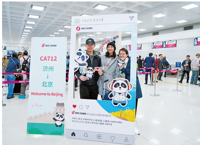
3月31日,在韩国济州国际机场,乘坐国航济州至北京航线班机的旅客在值机区拍照留念。

港澳台地区航线航班方面,民航局已批复37家航空公司的每周3385班客货运航班计划申请,包括内地与香港间每周1754班,内地与澳门间每周796班,大陆与台湾间每周835班。