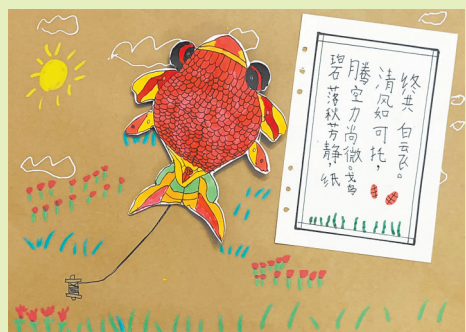
珠海市香洲区群贤小学 一(5)班 许景淋