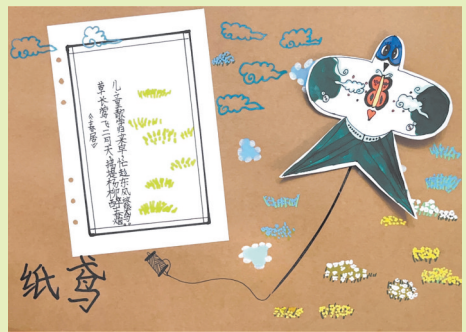
珠海市香洲区南湾小学 二(3)班 甘歆怡