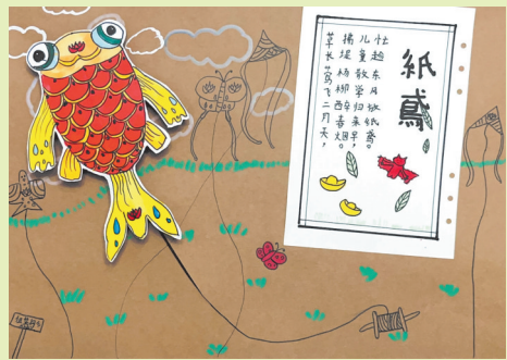
珠海市香洲区杨匏安纪念学校 二(4)班 伍芷彤