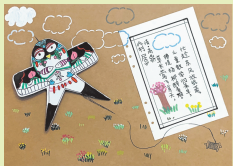
珠海容闳学校 二(3)班 宗干桐