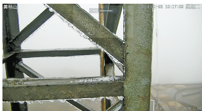
1月23日,摄像头拍到黄杨山出现冰挂现象。