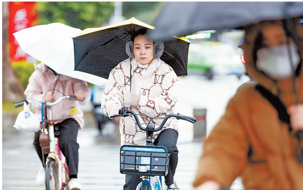
23日8时,拱北街头在寒风中出行的市民。

小颗、松散的冰粒,这些冰粒在降落过程中来不及融化就落到了地面,与有特殊和固定形状的雪、冰雹存在着显著区别。而冰挂是由于冰水碰到温度等于或低于零摄氏度的物体表面时