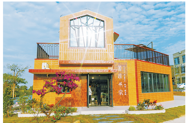
斗门区新马墩村善雅书房建成开放。

本报讯(记者陈怡蓁)毗邻万亩鱼塘，屋边静水流深，四周绿地环绕……在斗门区白蕉镇新马墩村党建公园旁，一座砖红色的建筑引人注目。这就是新马墩村村民期待已久的善雅书房珠光·新马驿。近日，该书房正式建成开放。