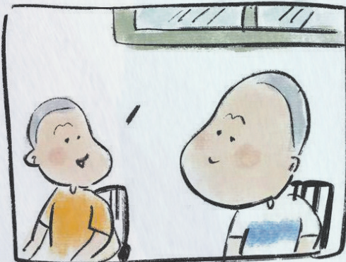
那可不，我们老师有三副！