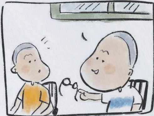
现在配个眼镜不便宜啊！