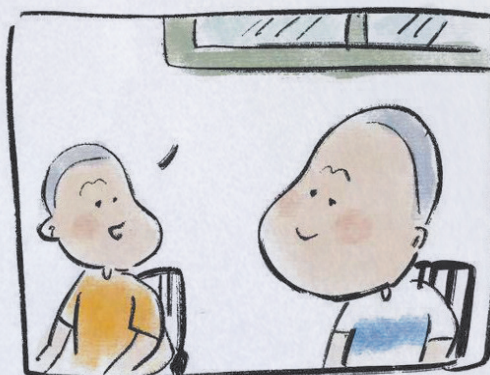
一副近视镜，一副远视镜。