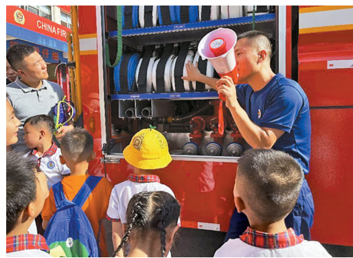
消防员介绍消防车的灭火救援设备。

人知道这罐子里装的是什么吗?”消防员指着消防车上的气罐发问。“氧气”“二氧化碳”……孩子们纷纷作答。“如果是纯氧或者是二氧化碳,我们都没有办法去灭火。这里面装的是压缩气体,就是压缩空气。”消防员揭秘道,通常一个气罐中的压缩空气能够维持一位消防员正常呼吸30-45