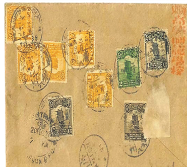
1924年2月4日国立广东高等师范学校英文西式公函封。