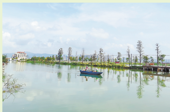
美丽三板河景色。