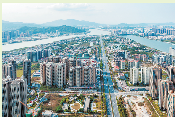
斗门区的交通越来越便利。

当前珠海正落实省“百县千镇万村高质量发展工程”，切实增强区、镇、村内内生发展动力，推动珠海城乡融合发展、全域高质量发展。《珠海市综合交通运输体系发展“十四五”规划》也明确，到2025年基本形成以珠海机场、珠海港为枢纽，高速公路、铁路、水路为主骨架，城际铁路、普通国省道为干线，农村公路为支线的多层次、枢纽型、网络化的综合立体交通体系。作为基础设施一体化、推进城乡融合发展的关键一环，愈发便捷的交通路网不仅将助力实现城乡区域基础设施通达程度更加均衡的目标，更激发区域经济共振效应，让美丽圩镇、宜居宜业和美乡村满足人们更多美好生活新期待。