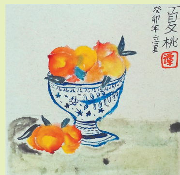
夏桃 珠海保税区第一小学 二(3)班 王诗玲 指导老师:大山