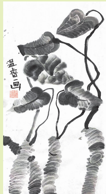
滴水观音(水墨画) 珠海市香洲区第十二小学 一(6)班 温睿 指导老师:许玉辉