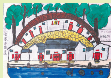
客家半围屋 珠海高新区金鼎第一小学 三(7)班 彭皓轩 指导老师:谢秀萍