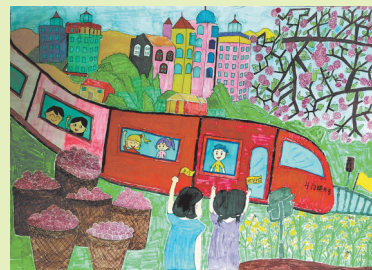
斗门乡村振兴 珠海市斗门井岸镇第一小学 三(四)班 杨敏熙 指导老师:宁雨迎