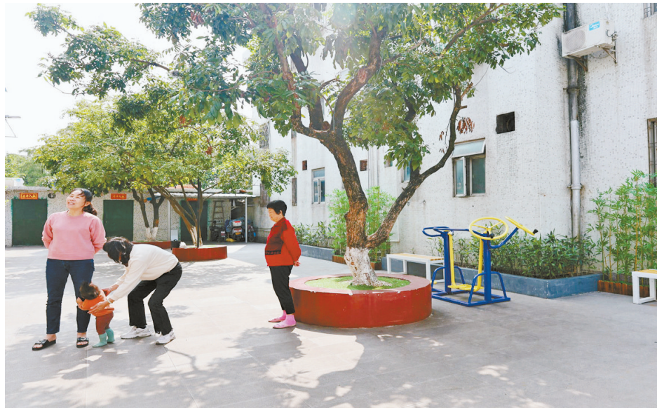
白藤街道“创美庭院”提升旧小区环境。

零里、芳华里、邻聚里……每户“创美庭院”门前,都设置了特色鲜明的庭院名称,还配有改造前后的对比图,让人对这里的变化一目了然。白藤街道好景社区妇联主席周耐玲介绍