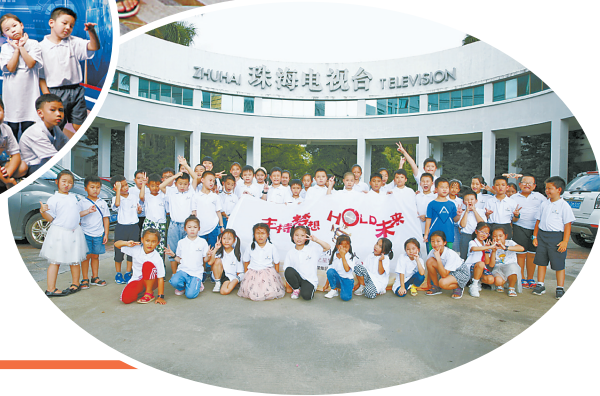
珠澳小主持人夏令营学员合影。