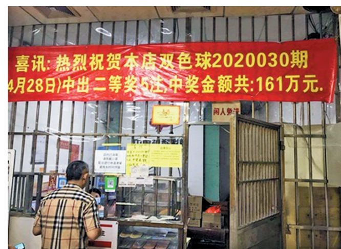
中奖站点的喜报。

4月28日晚,双色球20030期开奖。当期中山市黄圃镇一位彩民中得了5注二等奖,总奖金约161万元。但几个月过去了,这位大奖得主至今依然未露面兑奖。