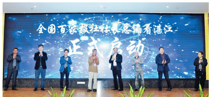
“全国百家报社社长总编看湛江”活动启动仪式现场。

据悉,中国晚报工作者协会成立于1985年10月,现有会员单位170余家,会员涵盖了全国所有地区晚报及主要的都市报,无论是发行量还是经营规模,中国晚报工作者协会媒体都稳居中国报业的“半壁江山”,其会员单位包括羊城晚报、北京晚报、新民晚报、今晚报、扬子晚报、钱江晚报、重庆晚报、郑州晚报、齐鲁晚报、珠江晚报、澎湃新闻等主流媒体。