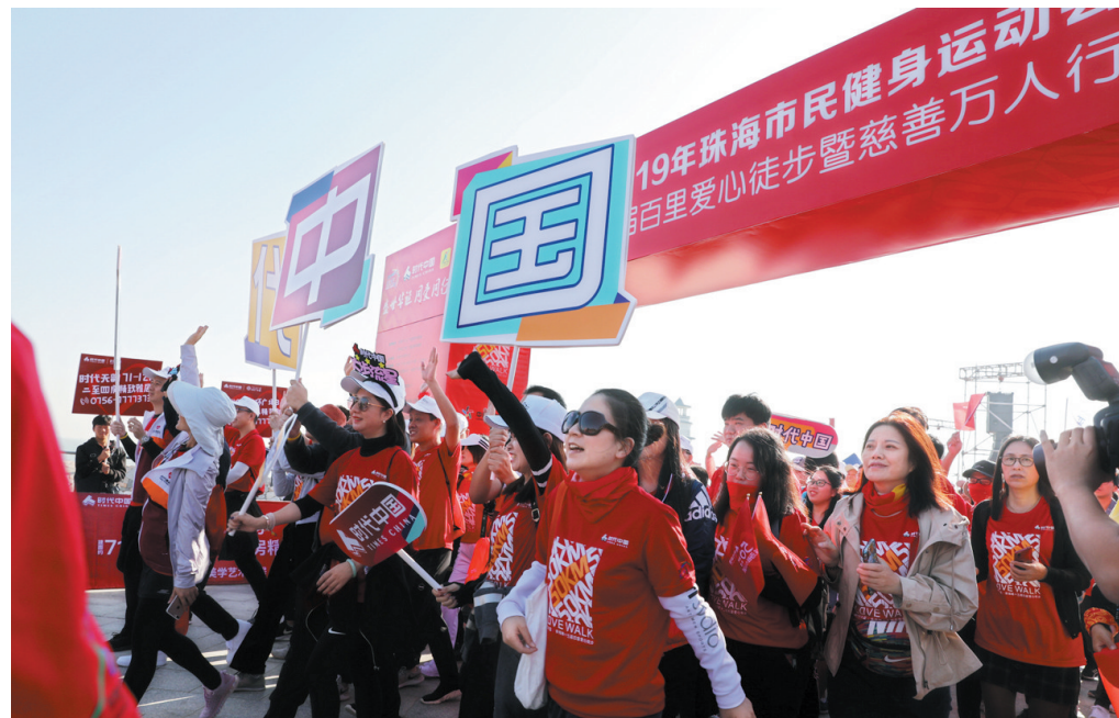
数千人集结出发开始徒步活动。