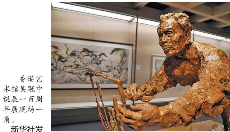
香港艺术馆吴冠中诞辰一百周年现场一角。