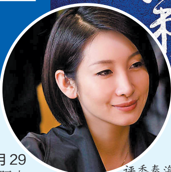
电影《第四面墙》海报