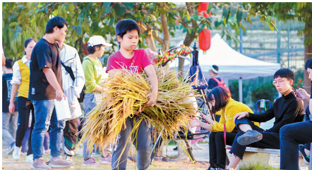
市民体验水稻收割。