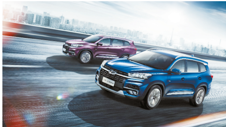
奇瑞“双11”销售冠军全新一代瑞虎8。

相比于往年,今年的“双11”除了手机、衣服、化妆品、生活电器等日常居家生活用品依旧是网购主流外,汽车也开始成为网购的“新宠”。