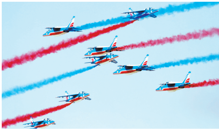
这是11月17日在阿联酋国际航空展当天在阿联酋迪拜阿勒马克图姆机场开幕。为期5天的2019年迪拜国际航空展。