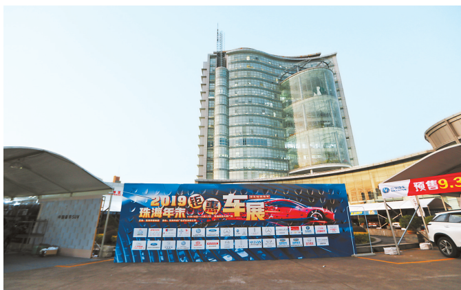
昨晚,车展布展就绪。

据了解,本次车展除有奥迪、英菲尼迪等豪华品牌车外,还有领克、轩达、长安、名爵等自主品牌车以及多款日系、德系、美系品牌车。此