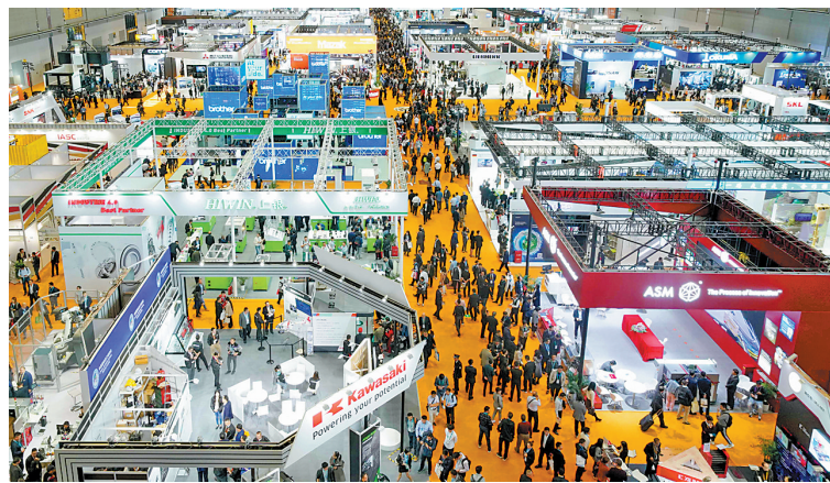
这是11月6日拍摄的进博会装备展区。