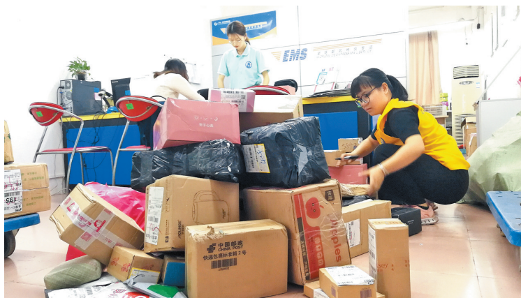
激增的快件预示着旺季的到来。