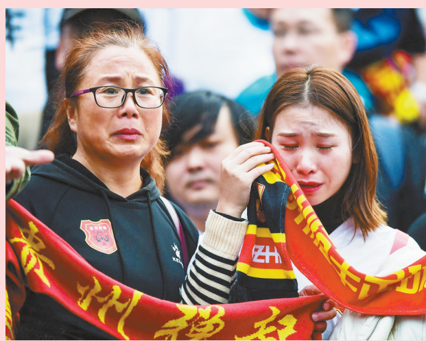
贵州恒丰冲超功败垂成,女球迷看台痛哭。