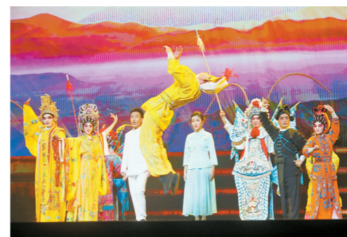
戏曲《赞歌声声献给你》。