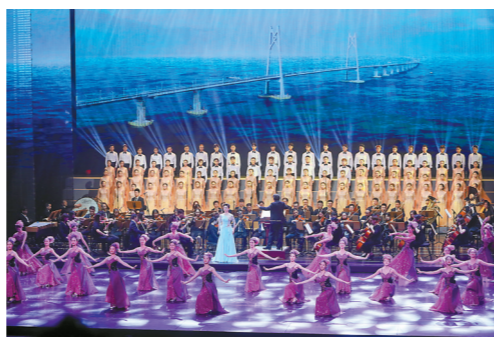
情景表演《不眠夜》、合唱《集合》《时代琴弦》。