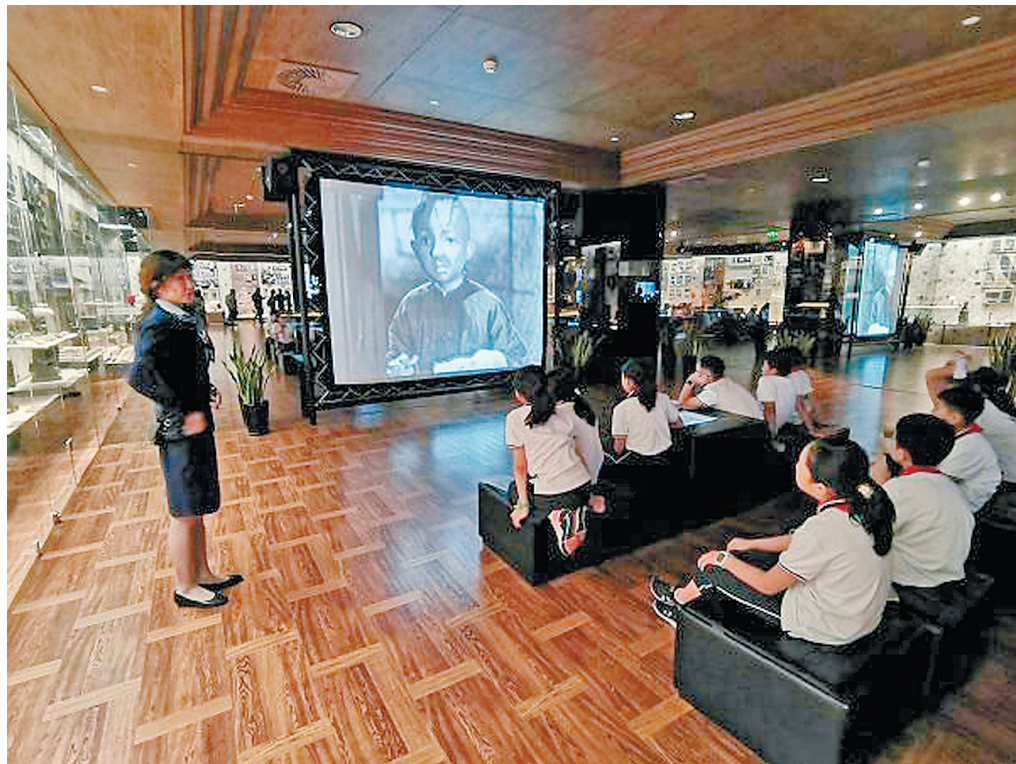
经典影片成为生动的教育资源。

据悉,此次活动主题鲜明,紧紧围绕隆重庆祝新中国成立70周年,充分发挥优秀影片在爱国主义教育中的独特作用。本届电影周通过影院、电视、网络、校园院线等多种渠道,集中展映了近30部优秀影片。为了使优秀影片观摩做到“全覆盖”,上海组织流动放映队走进外来务工人员子女学校,免费