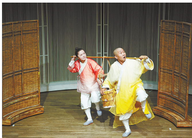
9月20日,在瑞典斯德哥尔摩,中国儿童艺术剧院的演员表演儿童剧《三个和尚》。

新华社斯德哥尔摩9月20日电 由中国儿童艺术剧院表演的儿童剧《三个和尚》20日在瑞典首都斯德哥尔摩上演,将这一中国经典故事演绎得活灵活现。