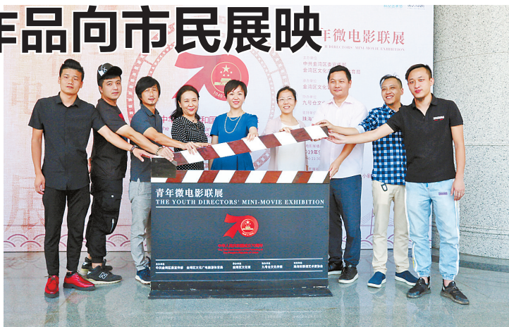
金湾区青年微电影联展昨日开幕。

据了解,此次青年微电影联展囊括了政府职能部门日常工作中的奋斗精神、非物质文化遗产传承过程中的故事,以及百姓在日常生活中的感人故事等多部青年导演的优秀作品,总计18部。其中,既有获