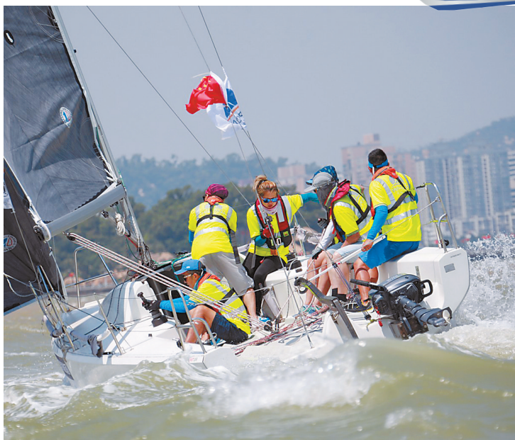
队员齐心协力控制帆船。

市委、市政府以及市文化旅游体育局的大力支持下,风帆运动在珠海大放异彩,省运会帆船帆板比赛、全国帆船帆板锦标赛、亚洲帆板及风筝板锦标赛等各项大型风帆赛事在珠海举行;最新引入的世界顶