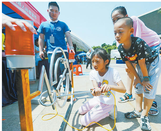
小朋友饶有兴趣地参加互动游戏。

据悉,市科协还将继续举办“长隆海洋科普进校园”“迎国庆、庆回归、同心同行——2019年珠澳青少年科普游”“社区及学校定向科普越野赛”等系列科普活动。