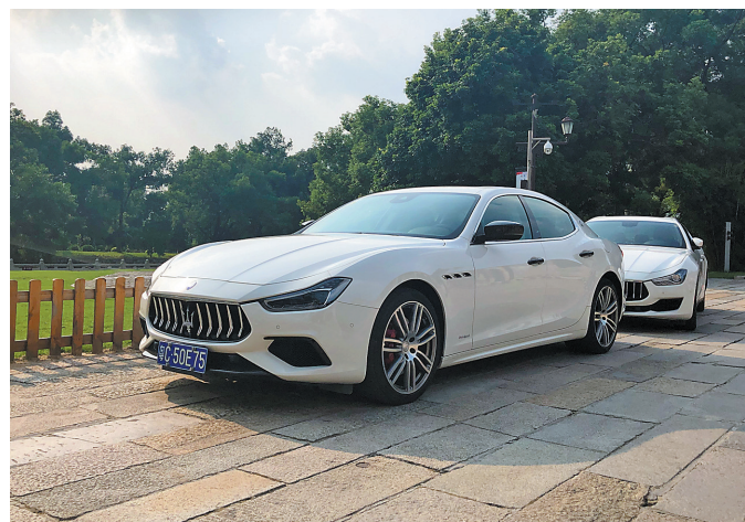
玛莎拉蒂 Ghibli。 广供

Ghibli展现了在全尺寸轿车市场中玛莎拉蒂品牌的独特品质:感性的意大利设计,专注运动化的设计理念,精致个性化的内饰和经济的燃油效率。在普通模式下,Ghibli的油门响应和动力输出特性都能为日常行驶带来舒适性,你完全不需费力去讨好油门踏板,它也会给你一个温柔的反馈。在切换到SPORT运动模式时,Ghibli有了明显的