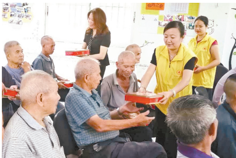
志愿者把月饼送到老人手中。

本报讯(记者廖明山 何进)为了让斗门区敬老院的老人过一个祥和、欢乐的中秋节,9月2日,斗门区红十字会联合爱心企业新顺业名湖海鲜酒楼开展“关爱长者·情满中秋”活动,十多位红十字会志愿者为560位老人送去节日的问候和价值3.8万元的中秋月饼。