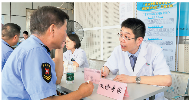
省中医院珠海医院专家为我市公交司机义诊。

人,学士学位741人。研究生学历148人,本科学历1060人,大专学历852人,中专学历612人。高级职称185人,中级职称685人,初级职称1751人。