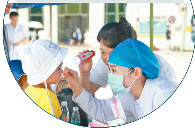
珠海市口腔医院医护人员为小朋友义诊。