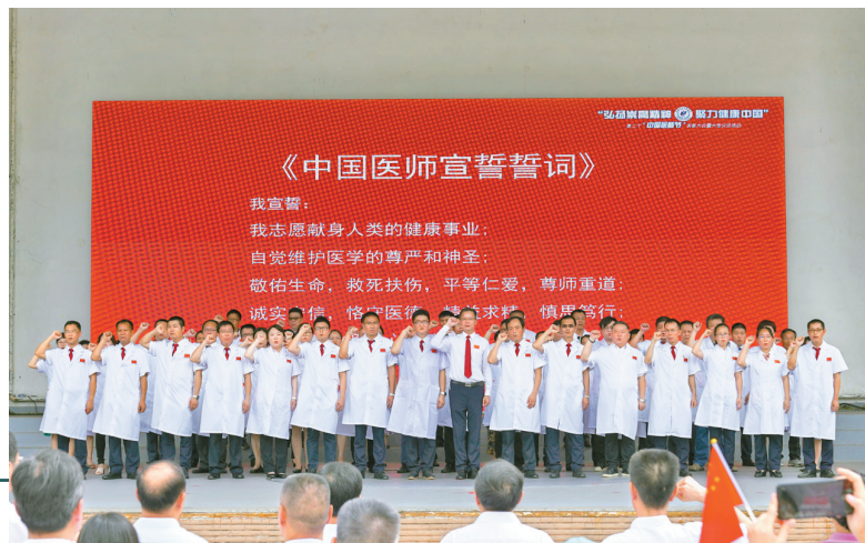
8月17日, 我市近200名医师代表参加集体宣誓。