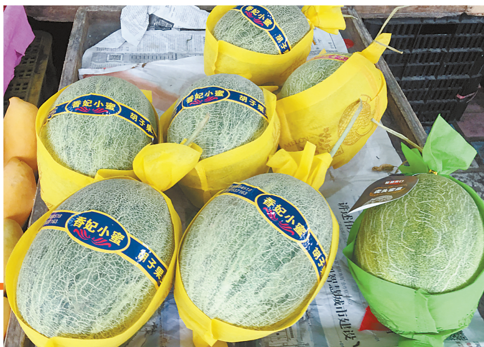
朋友圈购物,今天你@了吗?