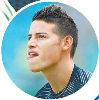
贝尔和J罗: 请神容易送神难。