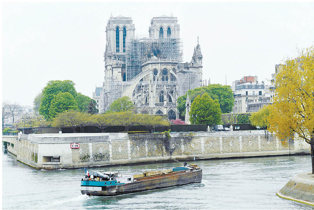
这是4月16日在法国巴黎拍摄的巴黎圣母院。

新华社北京4月16日电 15日傍晚,巴黎圣母院的塔尖轰然倒塌在熊熊烈火之中。大批法国民众站在塞纳河对岸目睹了此情此景,有人表情凝重,有人泪流满面。法国消防部门16日宣布,当天上午10时,大火已经“全部扑灭”。