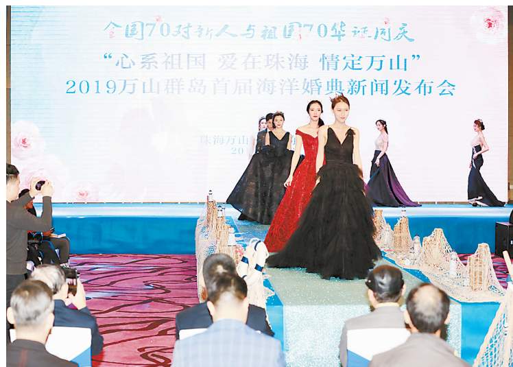
2019万山群岛首届海洋婚典新闻发布会现场。

本报讯(记者宋爱华)昨天,“心系祖国,爱在珠海,情定万山”2019首届万山群岛海洋婚典活动在东澳岛启动,今年九月来自全国的70对新人的盛大婚礼将在美丽的东澳岛举办。