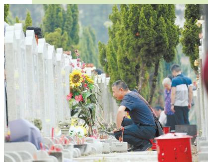
昨日,市民在多个墓园用鲜花祭拜亲人。

据了解,为了宣传殡葬改革成效、生态安葬政策,我市各大墓园通过悬挂“每逢清明倍思亲、一束鲜花祭故人”等文明祭祀宣传横幅的方式,鼓励市民携带鲜花祭祀先人,让人们在潜移默化中接受低碳环保的祭祀方式,弘扬移风易俗的丧葬新风。