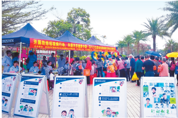
活动共发放结核病防治知识折页、册子等20种500余份。

本报讯(记者康振华) 3月24日是第二十四个“世界防治结核病日”,高栏港区社公局日前在平沙镇美平广场举办了“开展终结结核病行动,共建共享健康中国”主题宣传活动。高栏港区公卫中心、珠海市第五人民医院、平沙镇卫计办和爱卫办、平沙镇志愿者联合会,结核病防治志愿者等共同参与了本次活动。 现场活动针对什么是肺结核,及常见症状、传播途径、可预防可治等问题,工作人员以咨询义诊、展板展示、有奖问答、现场答疑、发放折页等多种形式向社会公众普及结核病防治知识。