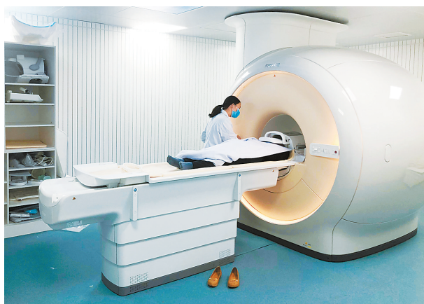
日前,市五院新引进原装进口磁共振设备正式投入使用。

本报讯(记者康振华 通讯员邝宇良) 日前,市五院新引进的飞利浦Ingenia1.5T新一代原装进口磁共振设备正式投入使用,服务百姓。从此以后,平沙居民告别了做磁共振检查必须去市区的历史。