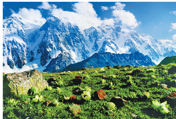
新疆是很多人向往的目的地。资料图片

近日,马蜂窝旅游网公布了“2019年度旅行地榜单”,推荐了广受中国年轻旅行者喜爱的十大国内目的地与十大国外目的地,还以旅行主题来划分,推出了8份个性化榜单,从自驾旅行、海岛旅行、亲子旅行、一个人旅行,到购物目的地、美食目的地、旅拍目的地、免签落地签目的地,向不同需求的旅行者做了全方位的目的地推荐。