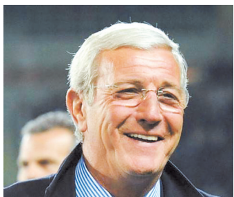
面对夺冠大热门伊朗,里皮该怎么出招?

和伊朗的交锋,极有可能成为里皮在中国的谢幕演出,尽管如此,经历过大风大浪的“老爷子”并没有透露出任何离别的情绪,反而提出了更高的目标。据报道,1月21日国