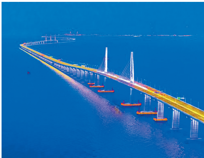
一等奖《珠帘般的美丽画卷——港珠澳大桥》朱泽辉