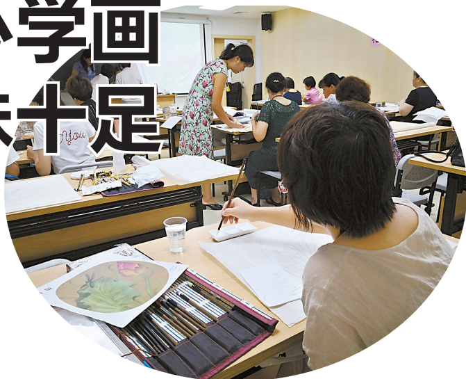
大妈一招一式认真学画。