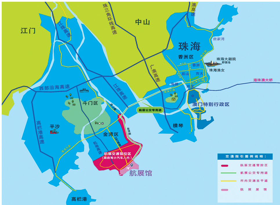
航展管控区域示意图。

第十二届中国国际航空航天博览会(以下简称“中国航展”)将于今年11月6日至11日在珠海航展馆举行。9月26日上午,航展交通保障工作新闻发布会召开,市交通运输局、市交警支队等职能部门相关负责人在会上介绍了今年交通保障的主要措施。记者了解到,总量控制、票务引导、小车管控、公交优先、智慧服务将是本届中国航展交通疏导主要举措。本届中国航展将首度为观展者提供乘车点导航、手机端预约航展客运专线座位等服务。