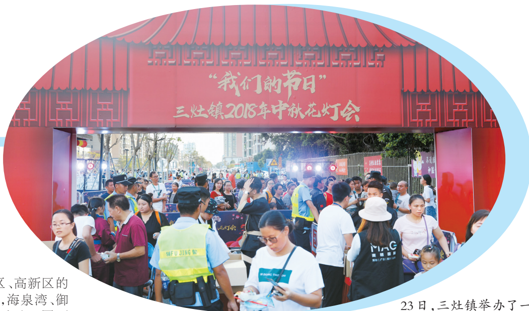
23日,三灶镇举办了一场传统文化和本土特色相结合的中秋花灯游园会,现场人山人海。