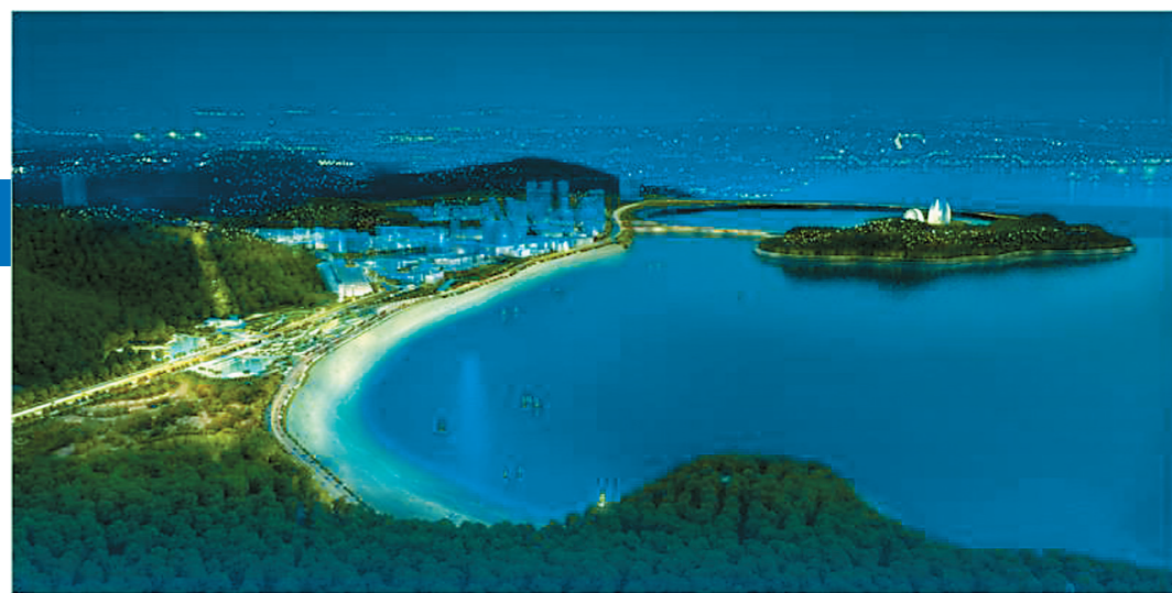
城市阳台效果图。受访单位提供