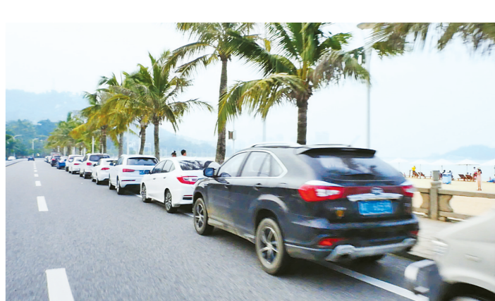
情侣路上,一眼望不到头的违停车辆。

统筹:本报记者 卢展晴 采访:本报记者 卢展晴 熊伟健