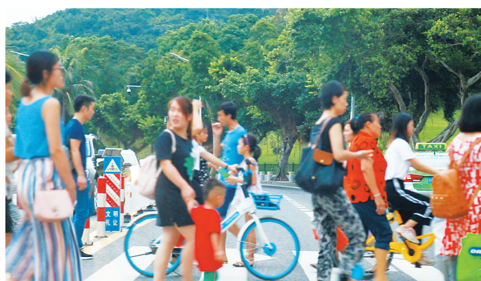
情侣路缺乏立体过街设施,大量过街行人也影响了车辆通行速度。

百度地图的分析结果也显示,根据监测,情侣路节假日拥堵系数远高于平常;平均时速远低于平常;拥堵里程远多于日常。