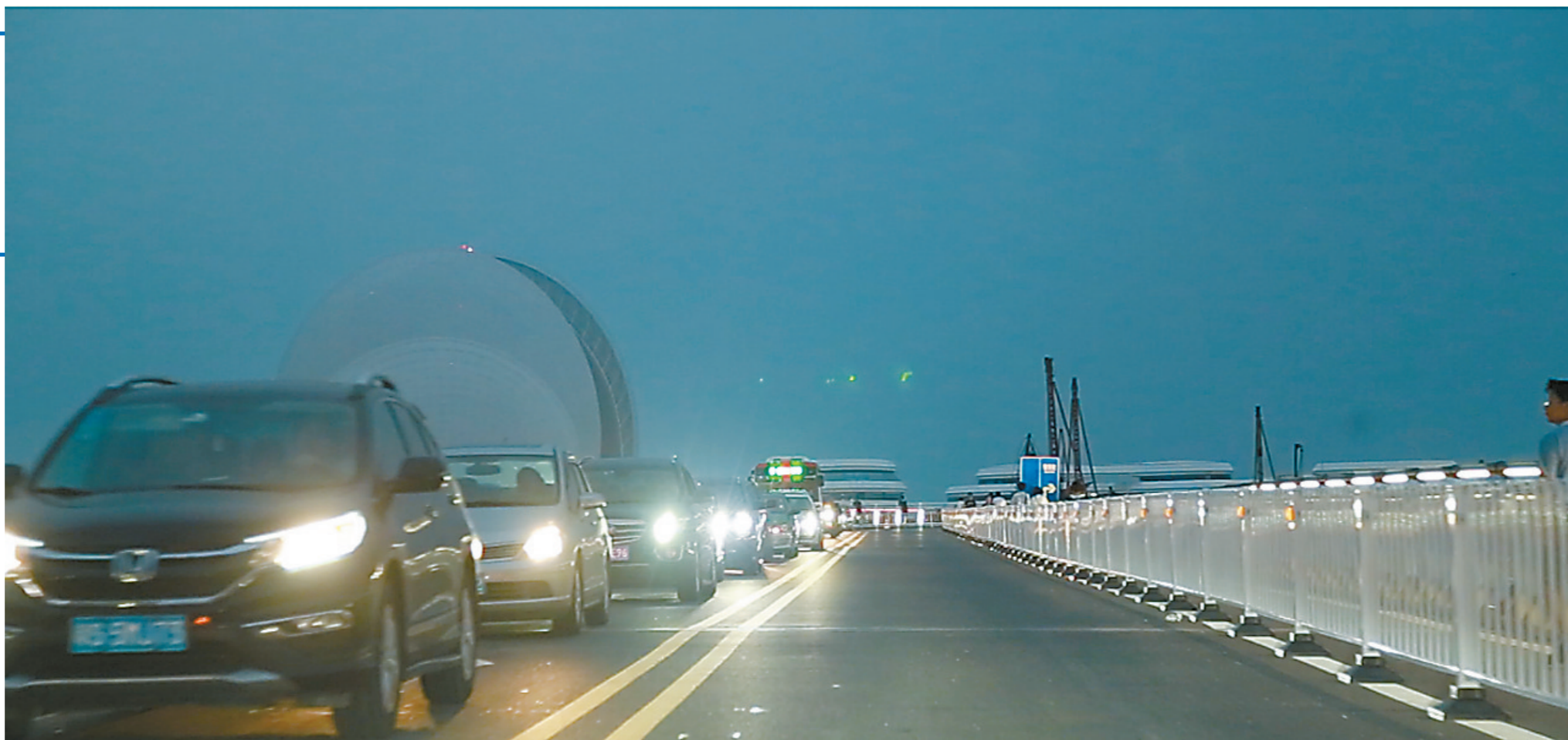
每逢节假日,情侣中路交珠海大剧院路段就成为最拥堵路段。