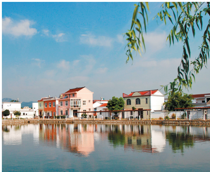
乡村品质建设开始提上议程。

在全国首创乡村规划师制度让设计下乡。记者近日在四川调研了解到,成都向全市乡镇派驻乡村规划师,代表乡镇政府履行规划职能。