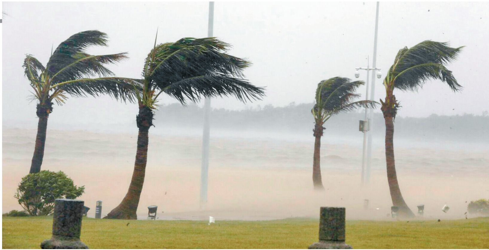
9月16日上午,受台风影响,珠海狂风暴雨齐至,香炉湾畔的椰树被狂风压弯了头。