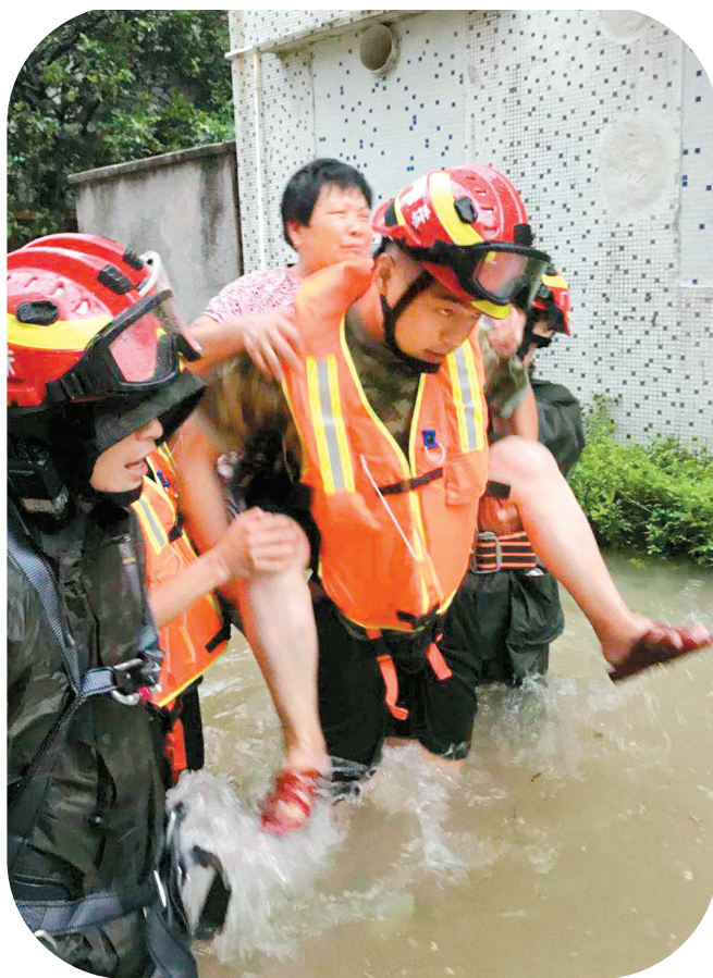
消防战士营救被困群众。