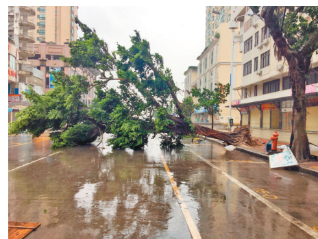
朝阳路上的巨树被狂风吹倒。