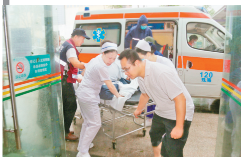
医护人员台风天坚守岗位,转运伤患。