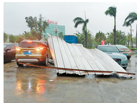
大块的挡板被狂风吹起,狠狠砸在汽车上。