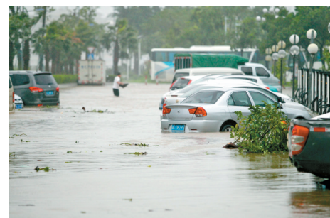
暴雨中停在路面的汽车,面临水浸的厄运。